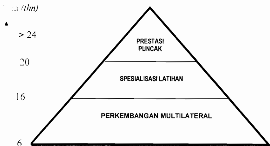
Gambar 2. Periodisasi Latihan Jangka Panjang

Berdasarkan dari pengelompokan usia pembinaan tersebut, maka periodisasi latihan olahraga dapat dikelompokkan menjadi 3, yaitu: (1) perkembangan multilateral, (2) spesialisasi latihan, dan (3) prestasi puncak.