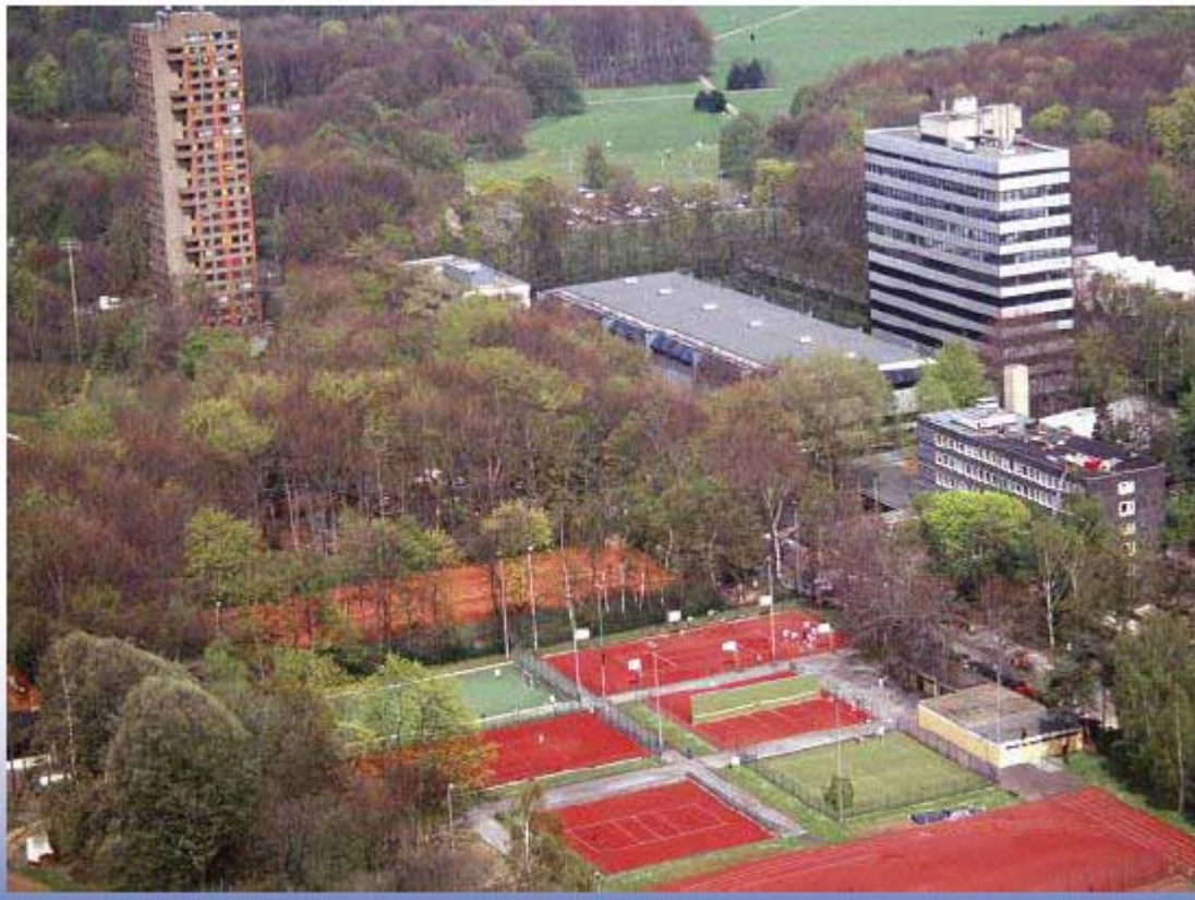
Gambar 2 : Birds Eye View of German Sport University Campus